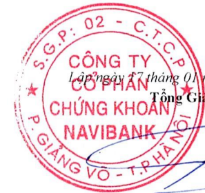
Đặng Huy Phong